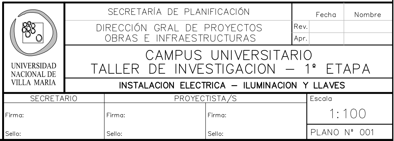
PLANTA DE INST. ELECTRICA - ILUMINACION Y LLAVES

EL REPLANTEO DE LOS ARTEFACTOS A INSTALAR SE HARÁ CONSIDERANDO LA UBICACIÓN DE LOS CANALONES DE H2O PREMOLDEADOS, REUBICANDO LOS MISMOS EN LA POSICIÓN MÁS CERCANA. SOLO QUEDARÁN CAÑERÍAS A LA VISTA SOBRE PIEZAS DE HORMIGÓN, LAS DEMÁS DEBERÁN IR EMBUTIDAS EN MUROS